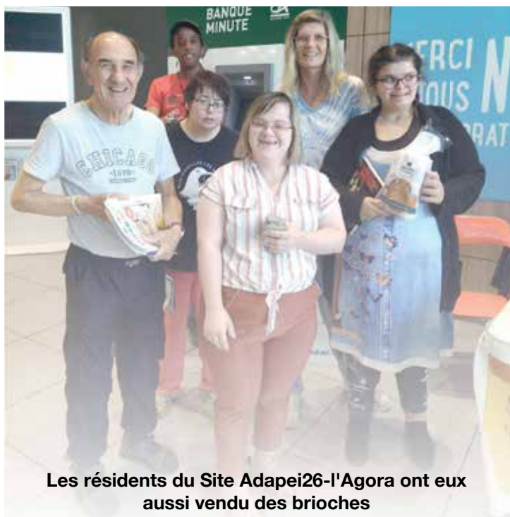
Les résidents du Site Adapei26-l'Agora ont eux aussi vendu des brioches